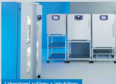
Laboratorní sušárny a inkubátory