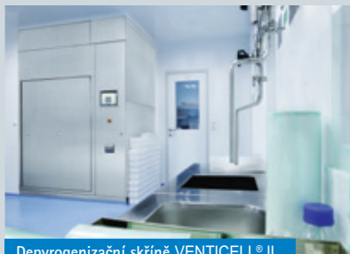
Depyrogenizační skříň VENTICELL® IL