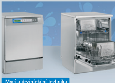
Mycí a dezinfekční technika