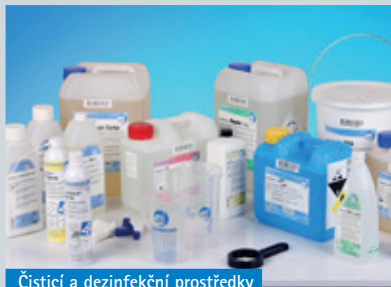
Čistící a dezinfekční prostředky